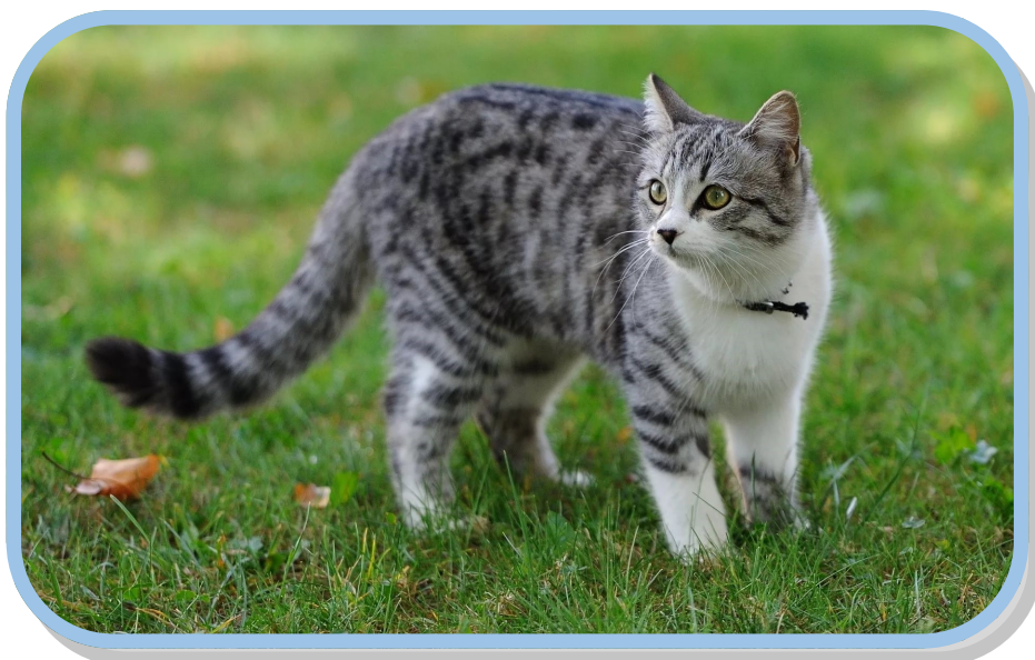
Уварова Евгения 7”В”